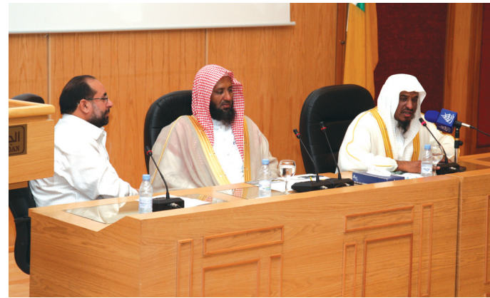
الشيخ الجبيلان يتحدث للطلبة

الحضارة الإنسانية. والشيخ الجبيلان داعية قدم محاضرات في عدد من الدول العربية والإسلامية والأجنبية تميزت بأسلوب شيق على نهج الرفق واللين والموعظة الحسنة.