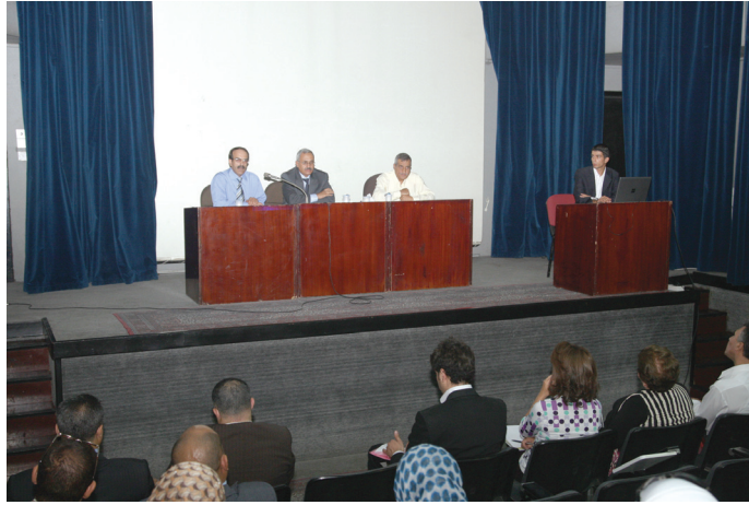
جانب من الحضور والمحاضرين

التي تتوزع بين متطلبات الجامعة والكلية والتخصص مؤكداً أهمية التدريب العملي في المؤسسات الاجتماعية لإكساب الطالب مهارات وخبرات فنية ومعرفية. وأكد المشاركون في الورشة الذين يمثلون مؤسسات وهيئات اجتماعية حكومية وغير حكومية وهي معتمدة لدى المعهد أهمية إقامة مثل هذه الورشة لتبادل المعلومات والخبرات حول الأسس والوسائل الحديثة لتدريب الباحثين والطلبة في تخصصات العمل الاجتماعي المختلفة.