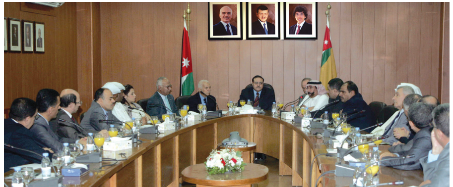
لقاء الدكتور الطويس بالملحقين الثقافيين

الجامعة- أعلن رئيس الجامعة الدكتور عادل الطويس عن توجه الجامعة لتقديم خدمة الإرشاد الأكاديمي بواسطة شبكة «الانترنت». وأضاف خلال لقائه في العاشر من تشرين الأول عددا من المستشارين والملحقين الثقافيين التتمة ... ص ٧