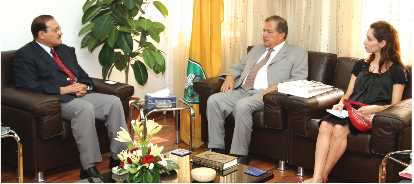
الدكتور الطوسي يلتقي بالسفير التركي

والذي أطلق برعاية جلالة الملكة رانيا العبد الله العام الماضي.