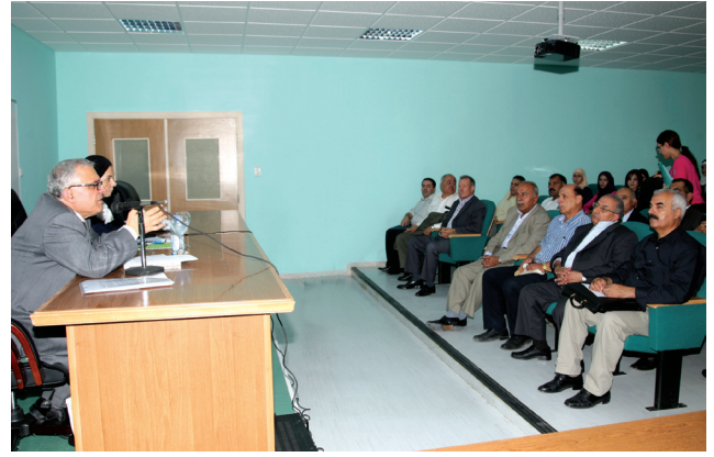
جانب من المحاضرة

ومفاهيمها الكبرى؛ بما في ذلك السيرة النبوية، إلى جانب المشكلات الفكرية والفنية أو التقنية الموجودة في ذلك التاريخ جدد لدي الاهتمام بظهور علم التاريخ العربي". واستعرض الدكتور السيد في المحاضرة التي نظمها قسم التاريخ والدائرة الثقافية في الجامعة في السابع والعشرين من أيلول الماضي علاقة السيرة بالتاريخ وفكرة نشأة التاريخ مستعينا بمقال كان قد نشره بمجلة المنارة التي تصدرها جامعة آل البيت بعنوان: من الخبر إلى التاريخ، فكرة التاريخ والكتابة التاريخية العربية.